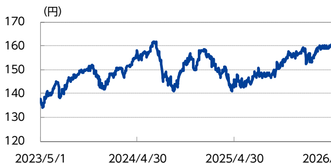
為替（米ドル・円レート）の推移（直近3年間）