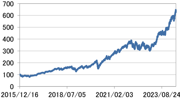
世界情報技術株式指数(円換算)

・世界情報技術株式指数(円換算)は、基準日前営業日のMSCI オールカントリー・ワールド インデックス / 情報技術(税引き後配当込み米ドル建)を基準日のわが国の対顧客電信売買相場の仲値により委託会社が円換算したうえ2015年12月16日を100として指数化したものです。