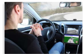
運転の自動(自律)化