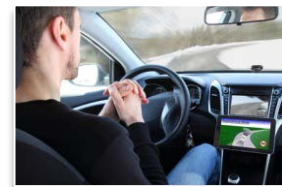
運転の自動(自律)化