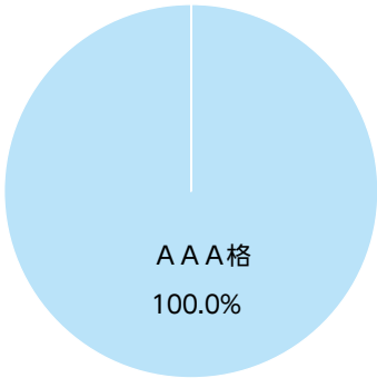
※対組入債券評価額比

※対組入債券評価額比 ※1 格付は、R & I、J C R、ムーディーズ、S & Pのうち、上位の格付を採用しております。以下同じです。 また平均格付とは、マザーファンドが組み入れている債券にかかる格付を加重平均したものであり、当ファンドにかかる格付ではありません。 ※2「デュレーション」＝債券投資におけるリスク度合いを表す指標の一つで、金利変動に対する債券価格の反応の大きさ（リスクの大きさ）を表し、デュレーションが長いほど債券価格の反応は大きくなります。 ※3「最終利回り」＝満期までの保有を前提とすると、債券の購入日から償還日までに入ってくる受取利息や償還差損益(額面と購入価額の差)等の合計額が投資元本に対して1年当りどれくらいになるかを表す指標です。 ※4「クーポン」＝額面金額に対する単年の利息の割合を表します。 ※5「平均直利」＝平均クーポン÷平均時価単価