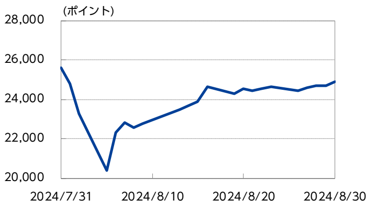
JPX日経インデックス400の推移

※ブルームバーグのデータをもとに、ニッセイアセットマネジメントが作成しています。